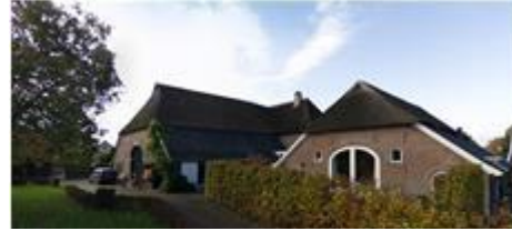
Meer dan 650 jaar later ziet "Gybbeconck" er zó uit.

Gerardus staat zonder twijfel aan het begin van de Zutphense Ruyterfamilie, al weten we nog niet hoe precies. Dat hij die aanspraken kan doen gelden toont aan dat hij tot de meer vermogende 'klasse' behoort. Ook zijn vermoedelijke kleinzoon Henrick , die aan het begin van de stamreeks staat en die in het testament van zijn dochter Ermgardis uit 1472 wordt genoemd, moet in deze eeuw zijn geboren.